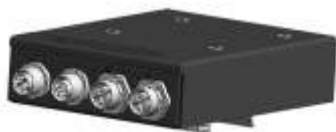
ПАК СКЗИ «ТИТАН-Шк»